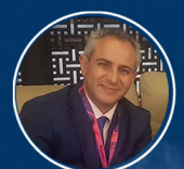
Studio AMCV TUNIS F. ADDAD